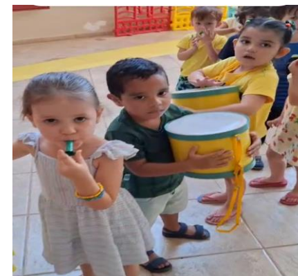
Atividade 5: Conhecer